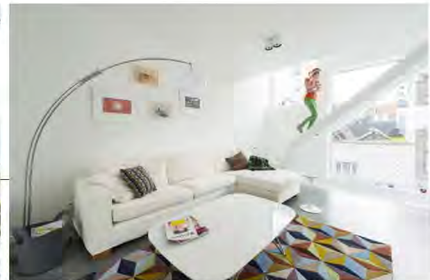
De zitkamer bevindt zich een etage hoger dan de keuken.

bed, dan gaat het naar de kinderkamer op de volgende verdieping. Hansi: "Die is ingedeeld in twee slaapkamers, een speelruimte en een functioneel badkamerje. De wanden zijn van gyproc en gemakkelijk te verplaatsen of weg te nemen, want het zijn geen dragende muren en ze zijn bovenop het polybeton geplaatst. Eigenlijk kan elk plateau een andere functie krijgen, afhankelijk van de levensfase waarin we zitten." Of ze nog weten waar de andere zit als ze naar elkaar roepen: ik zit boven of beneden? "Dat is een interessante vraag, maar tot nu toe hebben we elkaar altijd al gevonden", lacht Hansi. Ouders gaan meestal als laatste slapen, dus ligt de slaapkamer van Hansi en Sophie nog een etage hoger. En daarna komt de werkkamer van Hansi. "Met een buitenterras", glunderd hij. "Het uitzicht is fenomenaal. We kijken op de Schelde en de oude havenkranen die tot het erfgoed van het