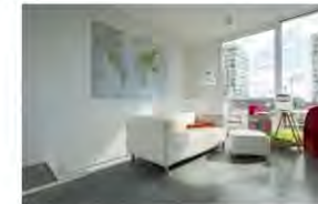
Op het slaapkamerniveau van de ouders is een zithoek gecreëerd als extra stilte-ruimte.