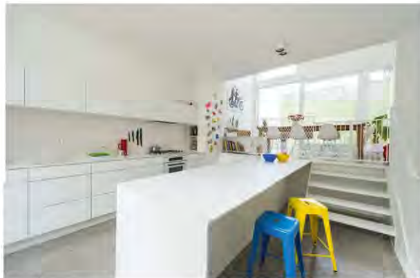
De keukentafel bevindt zich enkele trapjes hoger dan het aanrecht.